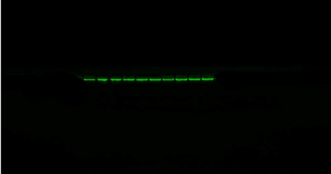
شكل ١: نتائج استخلاص عينات DNA

الاليل R1 ربما تعزى الى الاستراتيجيات الطويلة الامد التي اتبعت في الانتخاب ولصفات عدة في الدجاج المحلي العراقي.