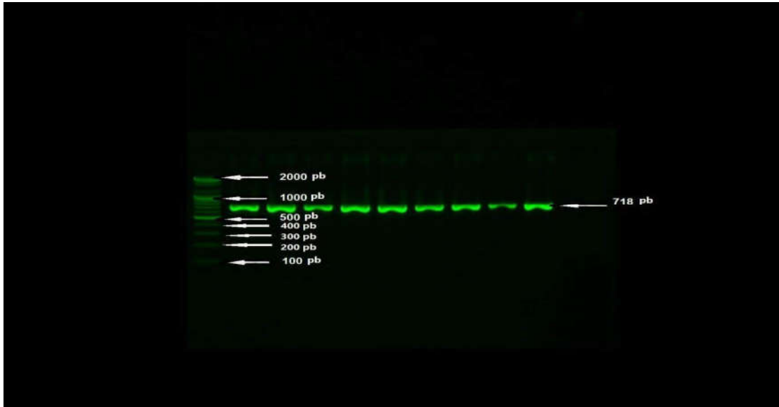
شكل ٢: قطعة الدنا 718 bp لجين مستقبل هرمون النمو الموكوثررة بواسطة تقانة PCR-RFLP والمرحلة على هلام الاكاروز ١.٦ .